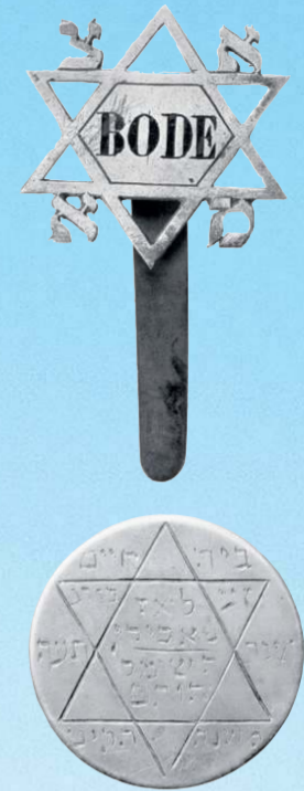
Grote foto: Joodse Begraafplaats Zeeburg aan de Valentijnkade in Amsterdam.

Dit artikel is gebaseerd op gesprekken met bestuursleden van de Stichting Eerherstel Joodse Begraafplaats Zeeburg en op het boek Zeeburg, geschiedenis van een joodse begraafplaats 1714-2014 van Bart Wallet (uitg. Verloren, 19 euro). Inf.: www.eerherstelzeeburg.nl